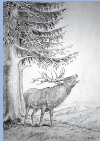
En haut: Cerf bramant , crayon sur papier, 38 X 30 cm, 1967.

Né avec le siècle, le XX e , il semble toujours avoir dessiné. A l'adolescence, il peint même quelques poyas. Après son mariage (1926), il se consacre à sa famille (12 enfants) et à l'exploitation de son domaine. Il n'abandonne jamais le crayon, le pinceau,