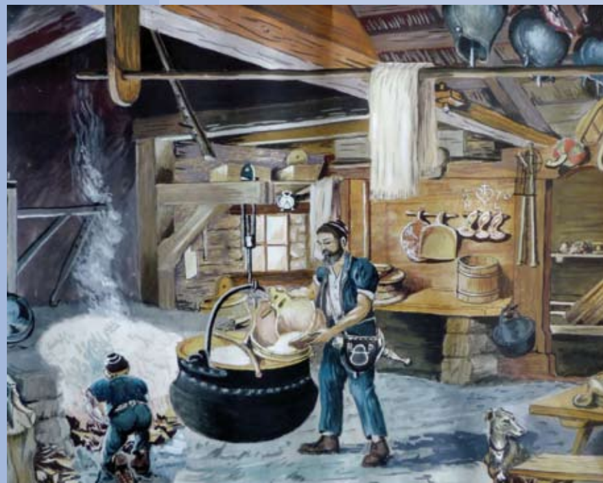
A droite: Chalet Oucliou (Allières), huile sur toile, 40 X 60 cm, 1966.

L'exposition rend hommage à Paul Yerly au travers de sa riche production: poyas, désalpes, vaches, mais aussi faune des Alpes et chevaux, son autre passion.