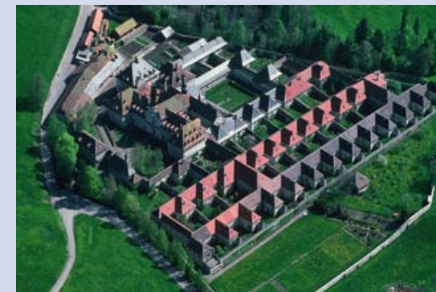
La Chartreuse de la Valsainte avec ses typiques ermitages (cellules des moines) et au centre la partie conventuelle: église, partie commune, cimetière.