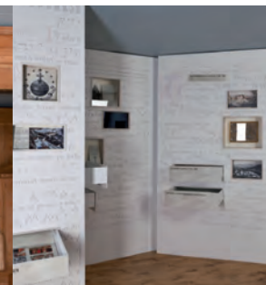
< Salle Valsainte au musée.

Au-dessus de Cerniat se situe la Chartreuse de la Valsainte, haut lieu de rayonnement spirituel. Les Chartreux s'y sont installés en 1294 et, depuis plus de 700 ans, leur histoire est liée à celle de ce pays. Au-delà des siècles, elle relie les époques témoignant de leur pérennité, de leur sérénité.