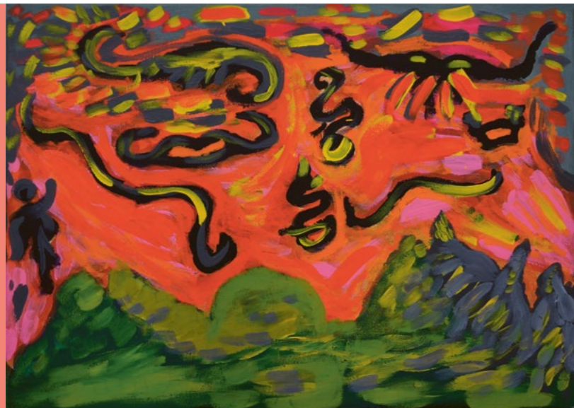
Iason Scyboz, Montagnes de Gruyère , acryl sur toile, 2020.